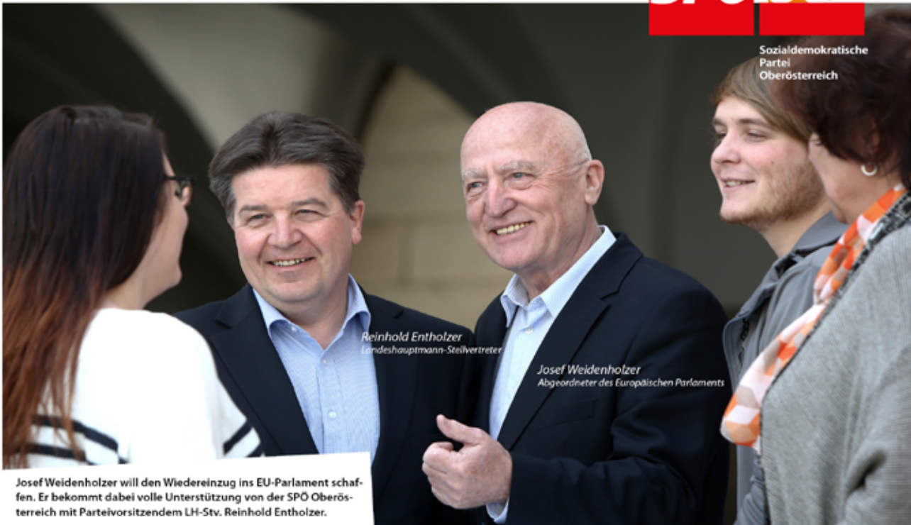
Reinhold Entholzer Landeshauptmann-Stellvertreter